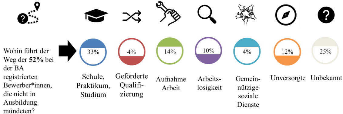
Abbildung 1: Verbleib der Ausbildungsinteressierten, die nicht in eine Ausbildung münden